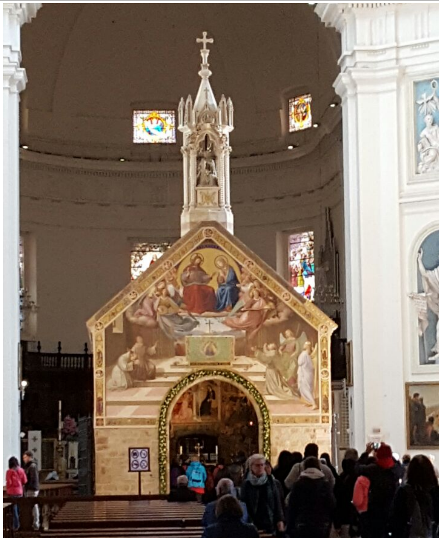
Portiunkula-Kapelle in Assisi